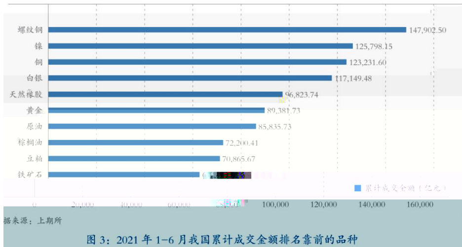
图 3: 2021 年 1-6 月我国累计成交金额排名靠前的品种